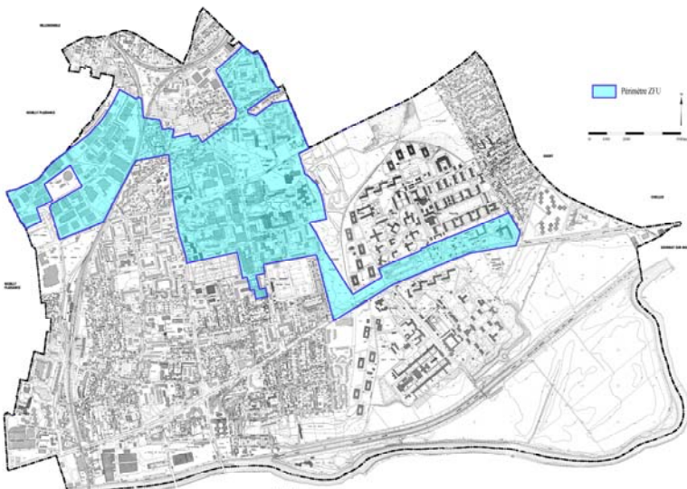
La Zone Franche Urbaine de Neuilly-sur-Marne

Ville de Neuilly-sur-Marne PRU V2 Décembre 2008