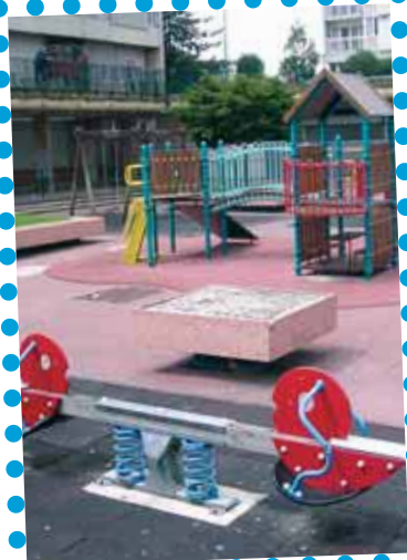
structures de loisirs devant la halte-jeux Louise Michel

Seuls les enfants domiciliés à Neuilly-sur-Marne et dont l'un des deux parents ne travaille pas peuvent être inscrits.