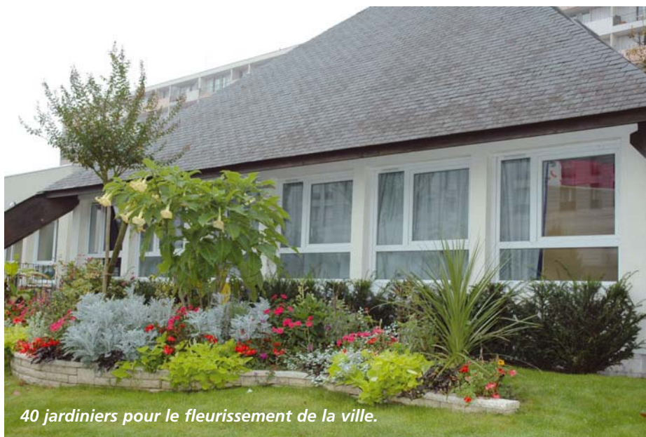
40 jardiniers pour le fleurissement de la ville.